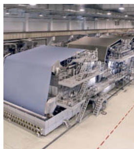
Industria della Carta