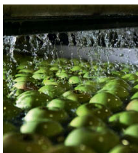
Industria Alimentare e delle Bevande