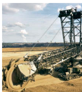
Industria Estrattiva e Mineraria