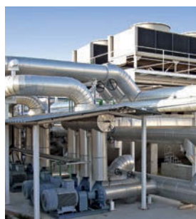
Pompe e Compressori